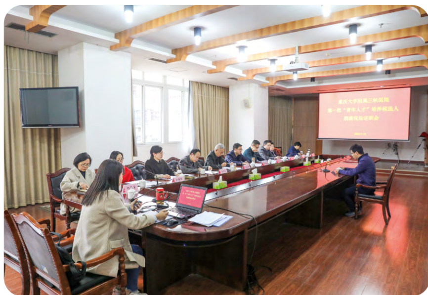
下一步,我们将紧扣“聚英才建一流学科”的年度核心主题要求,遵循人才培养规律,搭建三级培育架构,持续推进“三成”培养工程建设,落地实施各项政策措施,为医院高质量发展提供强有力的人才支撑。(人力资源部)

通过医院三年的培养,青年人才培养候选人取得了丰硕的成果,发表114篇论文,主持39项科研项目,1名获得重庆市中青年医学高端人才称号,13名参与升博计划,5名进入博士后科研站,7名晋升高级职称,11名担任挂职干部,18名聘任中层干部。